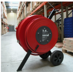
compact en stabiel