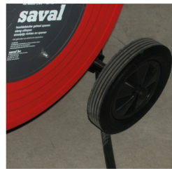
grote wielen voor obstakels