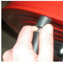
eenvoudige bediening voor het opwickelen