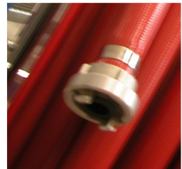
standaard Storz koppeling nok 31